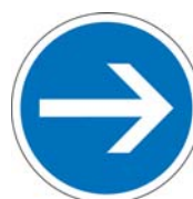
B21-1 Obligation de tourner à droite avant le panneau

La signalisation de guidage comporte un panneau B21.1 sur l'îlot central (lorsqu'il est infranchissable) face à chaque entrée,