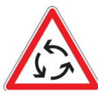
AB25 Carrefour à ses giratoire

La signalisation de priorité se compose du panneau AB25 (obligatoire) en annonce et du panneau AB3a accompagné de sa ligne d'effet.