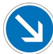
B21a1 Contournement obligatoire par la droite

et un panneau B21a1 ou une balise J5 (si l'îlot est précédé d'une ligne continue) en tête d'îlot séparateur.