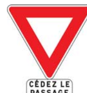
AB3a Cédez le passage à l'intersection Signal de position

La signalisation de guidage comporte un panneau B21.1 sur l'îlot central (lorsqu'il est infranchissable) face à chaque entrée,