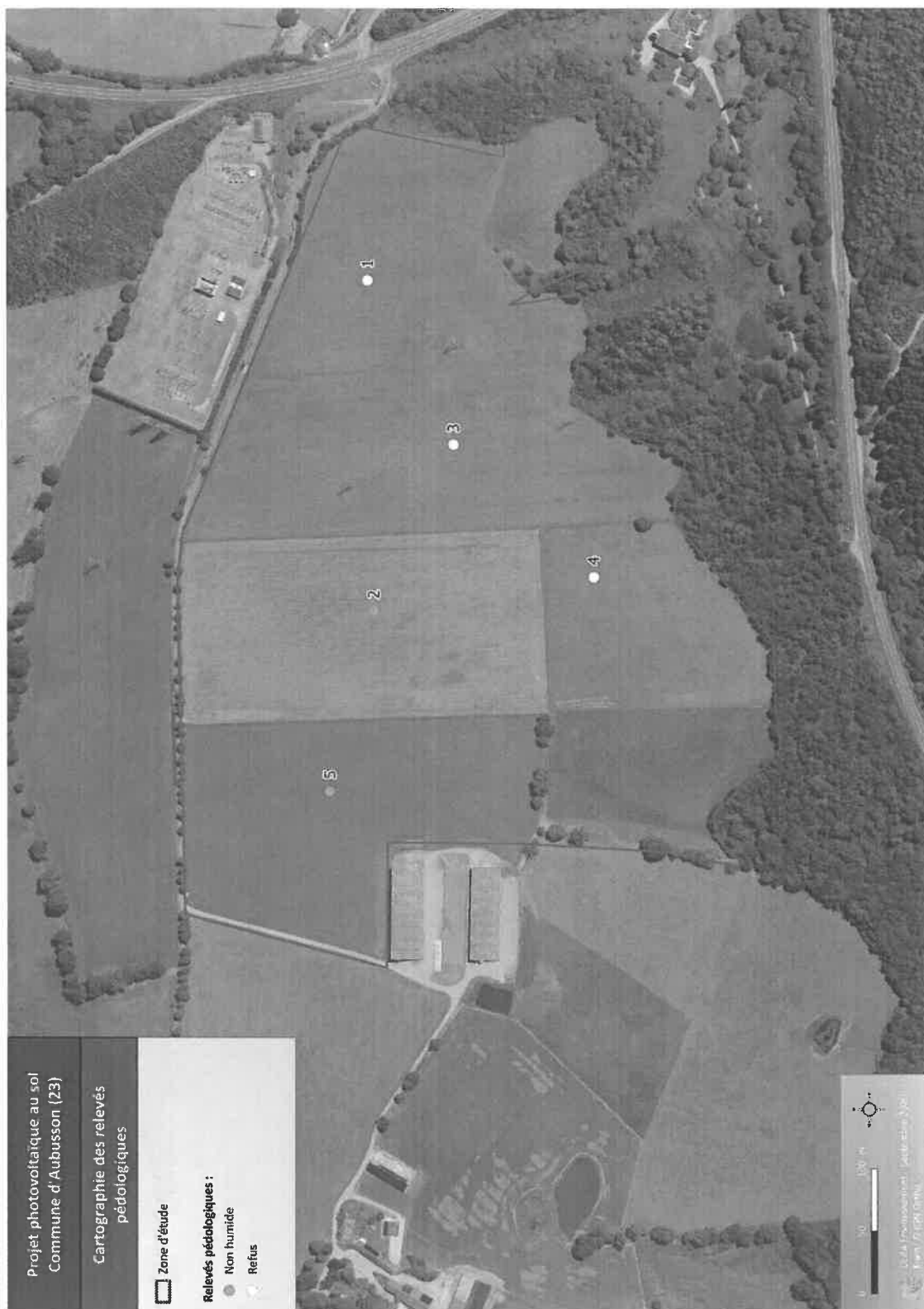
Carte 1. Localisation des milieux humides (critère pédologique) présents sur la zone d'étude.