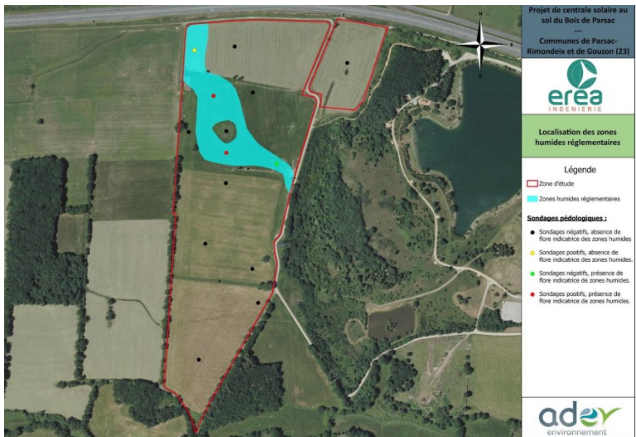
Cartographie des zones humides

Une zone humide a été identifiée au sein de la zone d'implantation du projet.