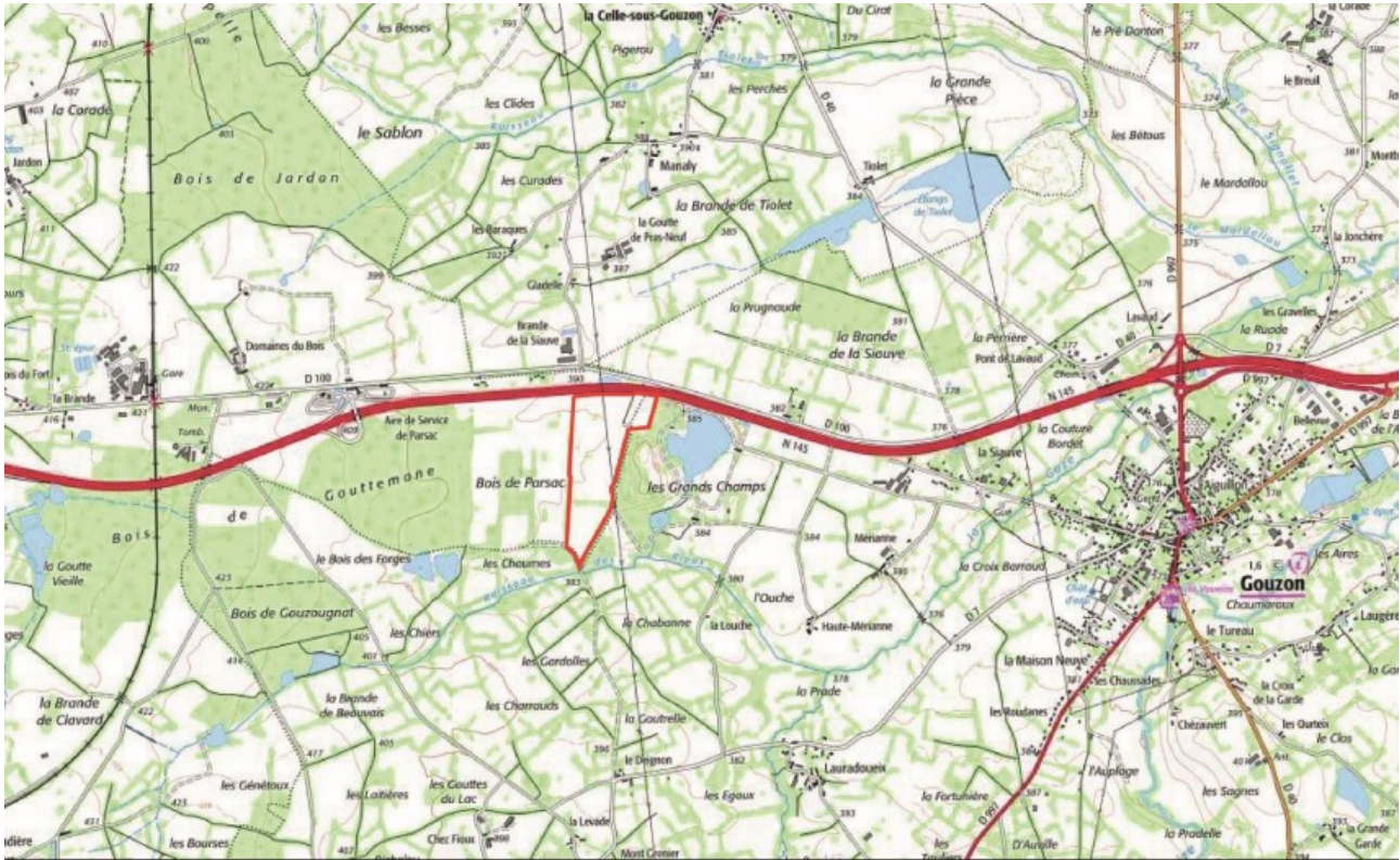
Aire d'étude du projet

Le projet s'implante sur environ 18,5 ha, dont 1,5 ha sur la commune de Gouzon, le reste se trouvant sur la commune de Parsac-Rimondeix. La durée d'exploitation se base sur un minimum de 25 ans, avec une possible reconduction de deux fois dix ans.