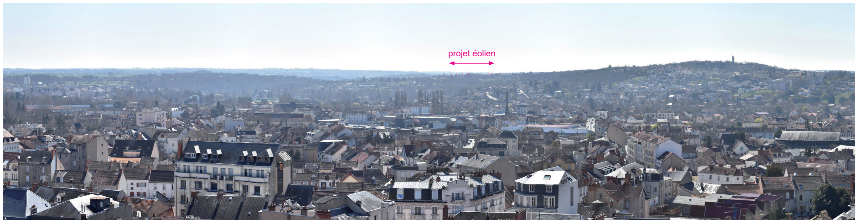
Photographie 114 : Vue en esquisse sur le projet éolien depuis le sommet de la tour du château des Ducs de Bourbon (Vue 2 du carnet de photomontages en annexe).

Les abords immédiats du monument offrent quelques visibilitées vers le projet, lorsque les espacements dans la trame bâtie le permettent. Des covisibilités sont également identifiées depuis la partie nord du périmètre de protection, notamment le long de la D151. La trame bocagère environnante ainsi que quelques boisements viennent atténuer ces perceptions. L'impact du projet éolien sur l'église Sainte-Thérence est évalué comme faible .