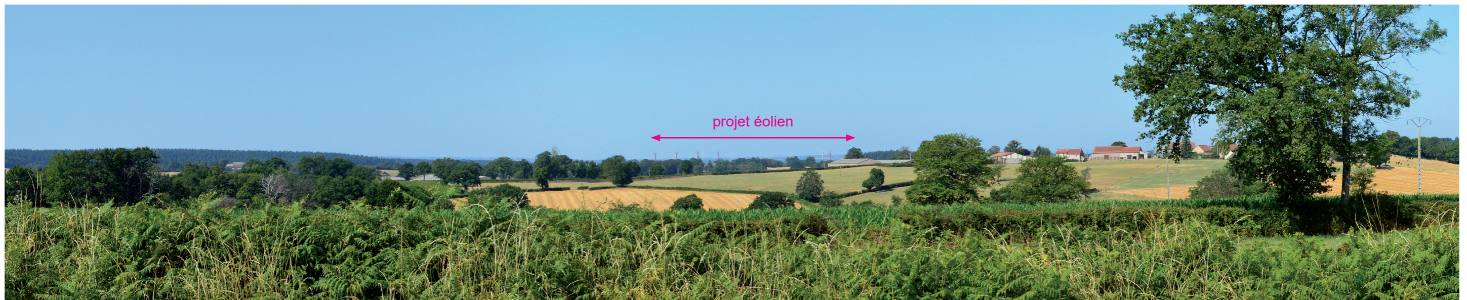
Photographie 113 : Vue depuis la D2144, près de la limite est de l'AEE (Vue 1 du carnet de photomontages en annexe).

Nous pouvons estimer que l'impact global du projet éolien de Chambonchard sur les axes de circulation de l'aire d'étude éloignée est très faible.