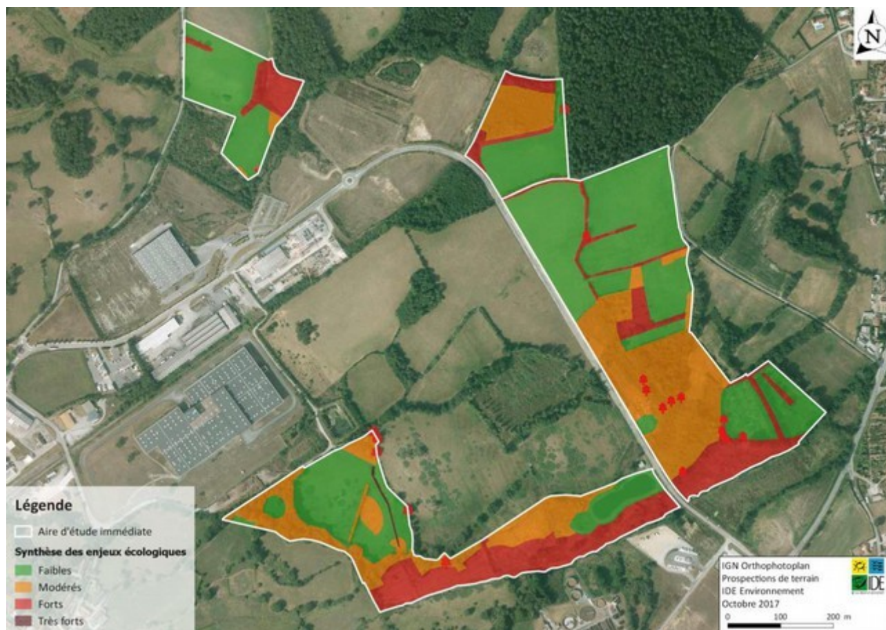
Figure 81 : Synthèse des enjeux associés au milieu naturel

Les inventaires ont également mis en évidence la présence d'espèces faunistiques protégées sur le site parmi lesquelles des oiseaux (Chardonneret élégant, classé vulnérable sur la liste rouge des oiseaux nicheurs du Limousin, Bruant jaune, Tarier pâtre), des reptiles, des amphibiens (Sonneur à ventre jaune) et des insectes (Grand capricorne du Chêne, Pique prune).