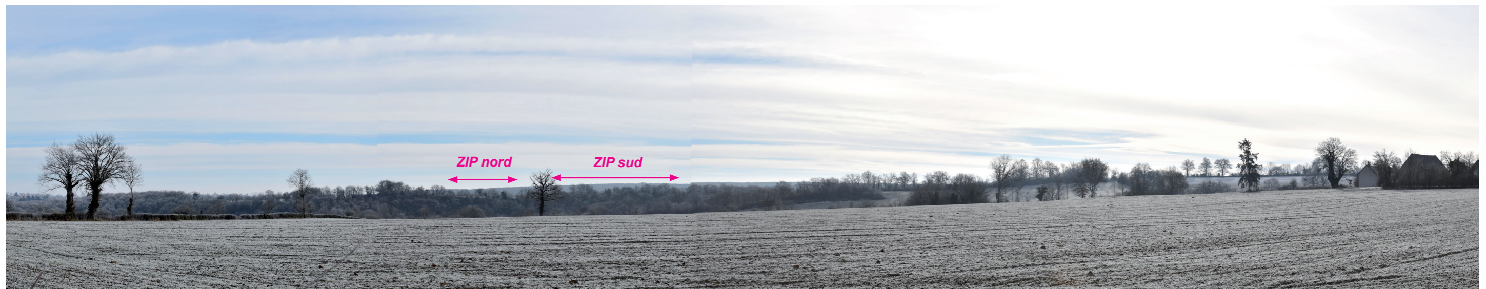
Photographie 34 : Vue en direction de la ZIP depuis la limite ouest du site emblématique des vallées de la Tardes et de la Voueize.